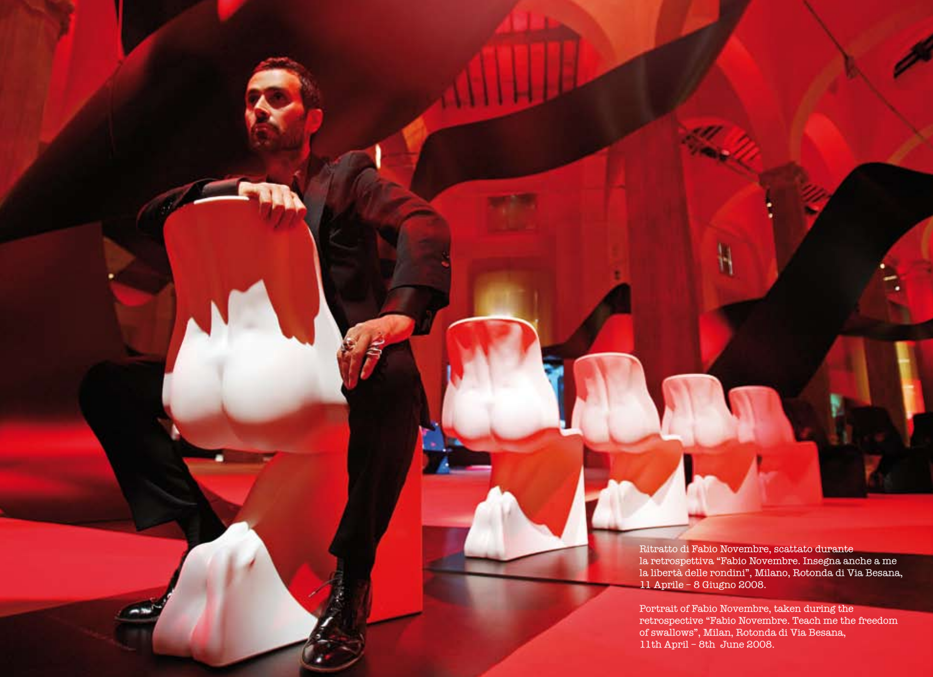
Ritratto di Fabio Novembre, scattato durante la retrospettiva "Fabio Novembre. Insegna anche a me la libertà delle rondini", Milano, Rotonda di Via Besana, 11 Aprile - 8 Giugno 2008.